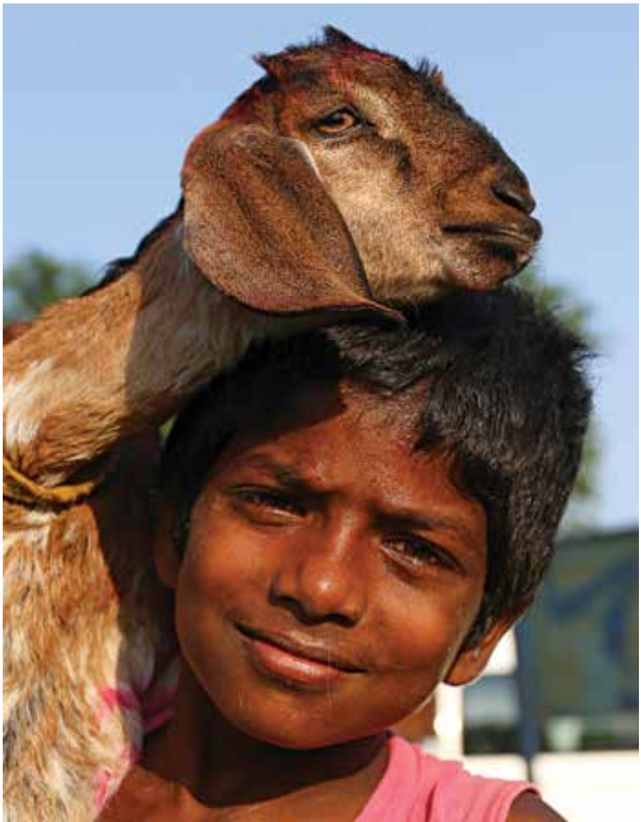
Lumbini, Nepal, 2015

Nu prea știu de ce-ți scriu. Simt că am mare nevoie de o prietenie căreia să-i încredințez nimicurile ce mi se întâmplă. Poate că-mi scriu chiar mie.